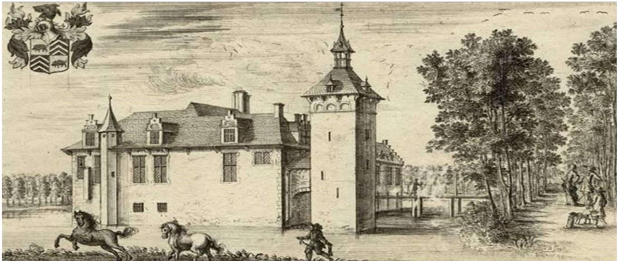
Gravure Castellum de Schilde, 1678 door Jacques Le Roy

Toen Karel van de Werve (°1627 - † 1696) in 1681 eigenaar werd zag het er grotendeels uit zoals op de hieronder afgebeelde gravure die een kasteel toont met een vierkantvormige verdedigingstoren die los stond van het kasteel. Die toren was waarschijnlijk het oudste deel van het kasteel. Een overdekt bruggetje verbond de toren met de gelijkvloerse verdieping van het kasteel. Ook op de zolderverdieping was er een verbinding.