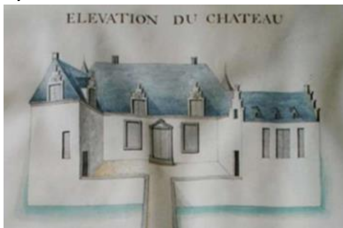
Voorgevel kasteel rond 1720

Rond 1720 werden een plattegrond en zijaanzichten van de bestaande toestand van het kasteel opgemaakt. In deze periode was er een renaissancetuin aangelegd met compartimenten gescheiden door een geometrisch grachten- en drevenstelsel. Het domein bestond uit een bos en werkgrond. Voor het kasteel lag de 'base cour' met links en rechts van het toegangspad een schuur en huis van de hovenier. Het kasteel zelf was gelegen in het canal (rechtlijnige vijver) en verbonden met het Schijn.