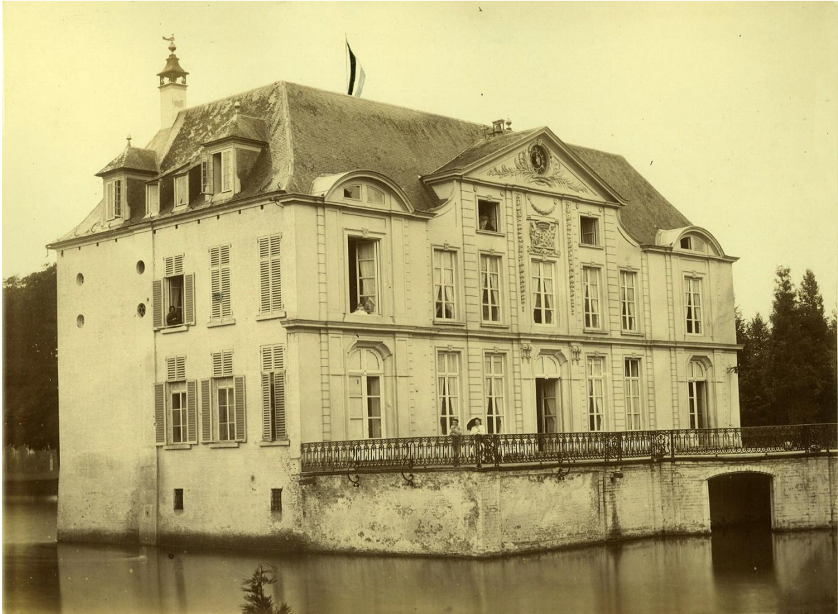
Foto uit 1870 van het kasteel zoals het er uitzag na de verbouwingen 1755-1758.