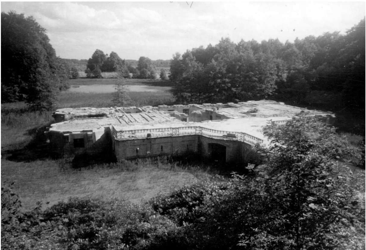
Grondvesten van het kasteel rond 1970

Maar het bleef bij plannen en een mooie maquette. Wanneer de barones in 1951 overleed stond het kasteel al 27 jaar leeg en bleef er maar één optie over – de afbraak van het kasteel.