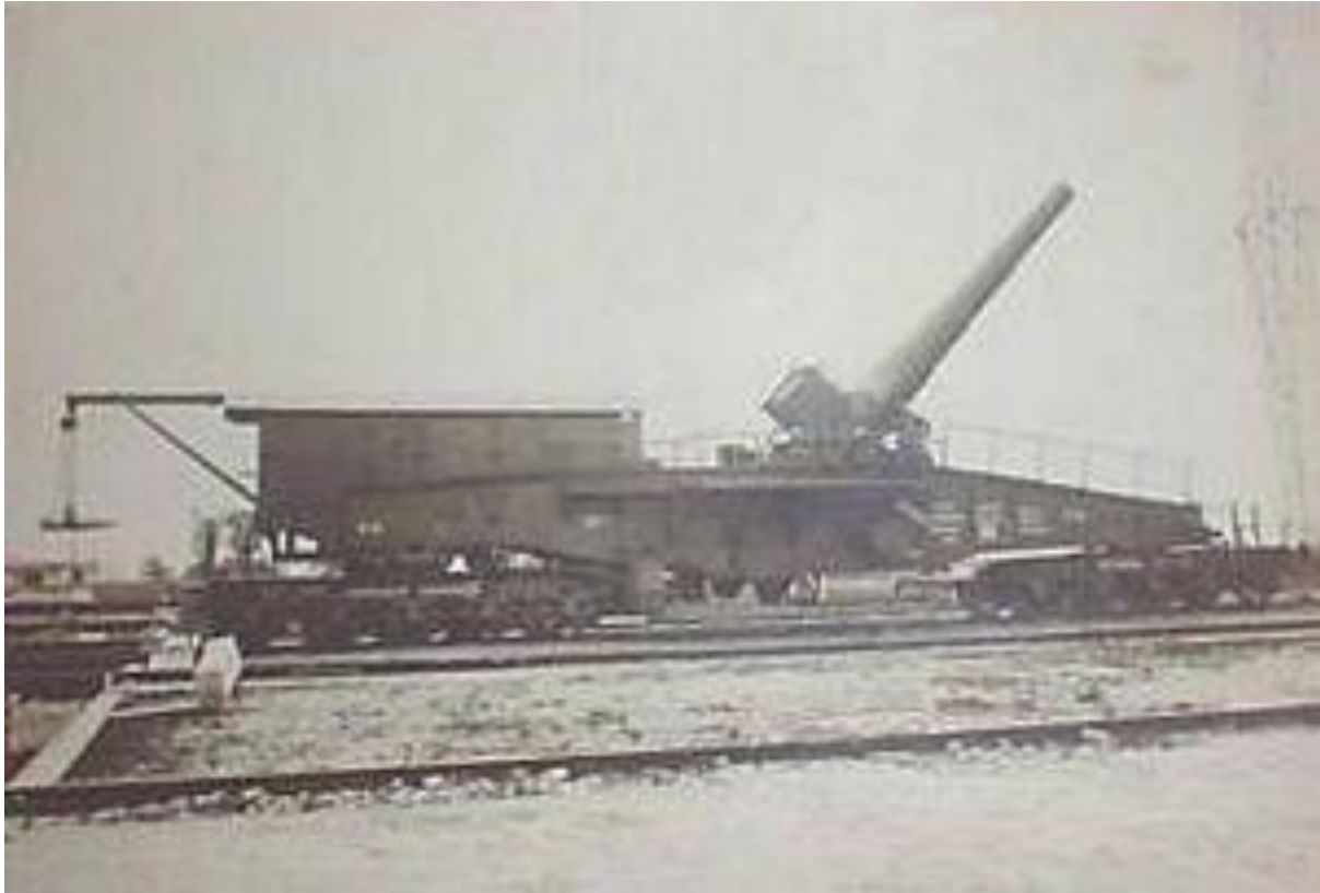
Spoorwegkanon van 170mm

Tist behoorde tot de A.L.V.F., de Artillerie Lourde sur Voix Ferrée. Het Belgisch leger maakte gebruik van treinen waarop zware kanonnen gemonteerd stonden. Sommige van die wapens waren na WOI gerecupeerd van de Duitse vijand.